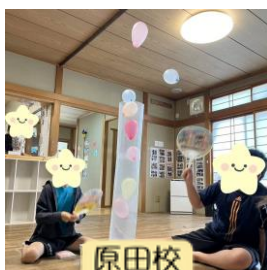
原田校 「飛び出せ風船」