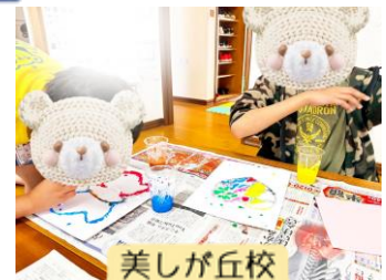
美しが丘校 「ソルトペインティング」