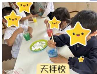
天拝校 「炭酸マグマ」