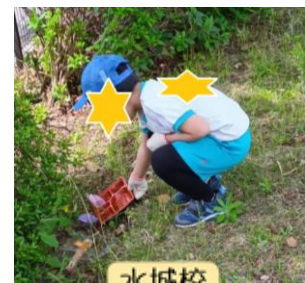
水城校 「公園ピカピカ大作戦」