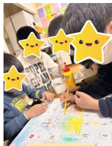
美しが丘校 「3月カレンダー作り」