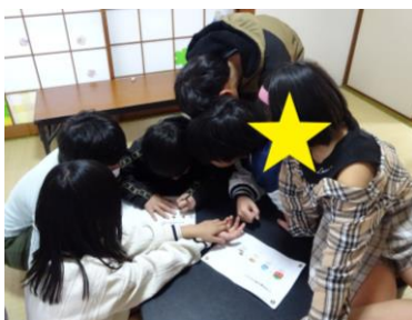
二日市南校 「宝探しゲーム」