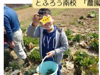
とふろう南校 「農園」