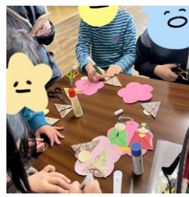
原田校 「ひな飾り作り」