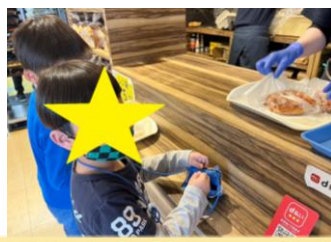
水城校 「パン屋さんでお買い物」