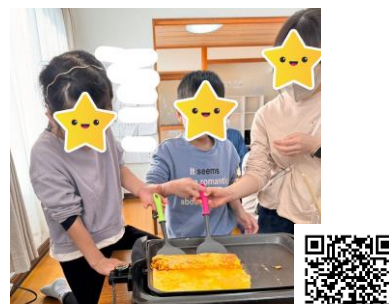
美しが丘校「お弁当作り」