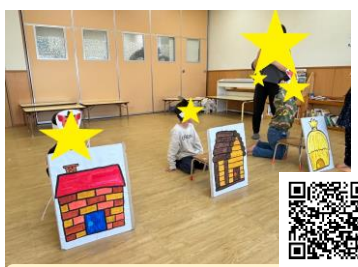
水城校「オペレッタ」