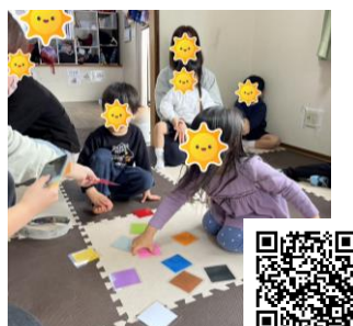
天拝校「色探しゲーム」