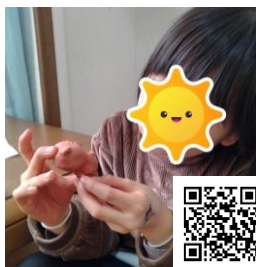
とふろう南校 「素焼き粘土工作」