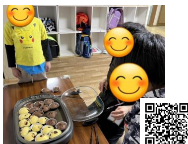
原田校「チョコ蒸しパン作り」