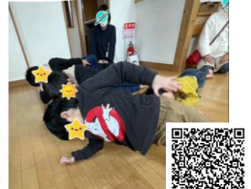
神社前校 「小鴨先生トレーニング」