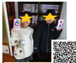
二日市南校 「スタンドグラス作り」