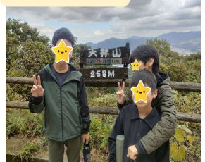
二日市南校 「天拝山登山」